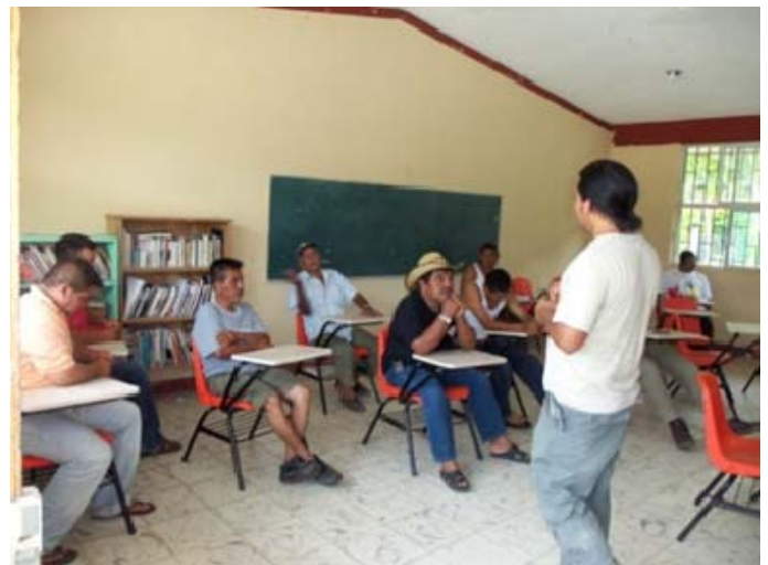
Personal de PPY trabajando en la organización del CVP en Conhuás

Se impulsó la formación y la capacitación de los comités de vigilancia participativa (CVP) de las comunidades Narciso Mendoza y Conhuás. El objetivo es involucrar a las comunidades en actividades de conservación y uso sustentable de los ecosistemas y su biodiversidad en sus tierras ejidales. A la fecha se les ha brindado capacitación en leyes y reglamentos aplicables en el sector ambiental y herramientas de planeación. En este proyecto participa la Reserva de la Biosfera Calakmul, la Procuraduría Federal de Protección al Ambiente (PROFEPA) y Pronatura. Este proyecto es financiado por el Programa de Desarrollo Forestal Comunitario implementado por CONAFOR.