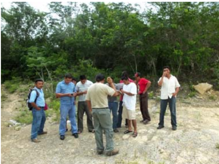
Práctica de campo para el uso de GPS