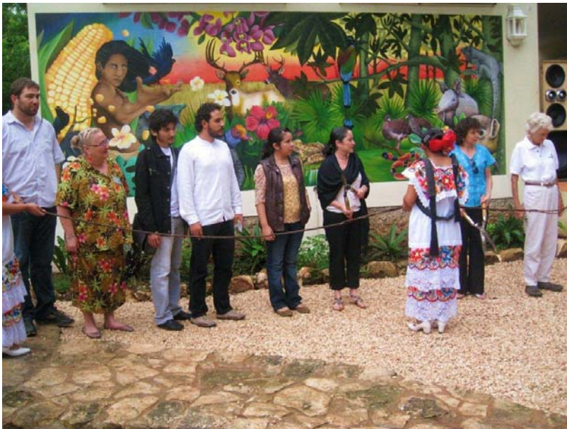
Corte del listón del evento

Durante los días 14, 15 y 16 de Octubre realizaron diversas actividades lúdicas y culturales para conmemorar el primer año de haberse constituido formalmente con un espacio que promueve la importancia del patrimonio natural y cultural de la comunidad de Yaxunah. En este marco realizaron un maratón de aves con la participación de 40 jóvenes y el quipo ganador los representará en la X Edición del Maratón de Aves Xoc ch'ich a realizarse el 26 y 27 de noviembre. ¡Visita la comunidad de Yaxunah y conoce más sobre su cultura!